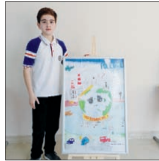
Suyun səyahəti şagirdlərin rəsmlərində